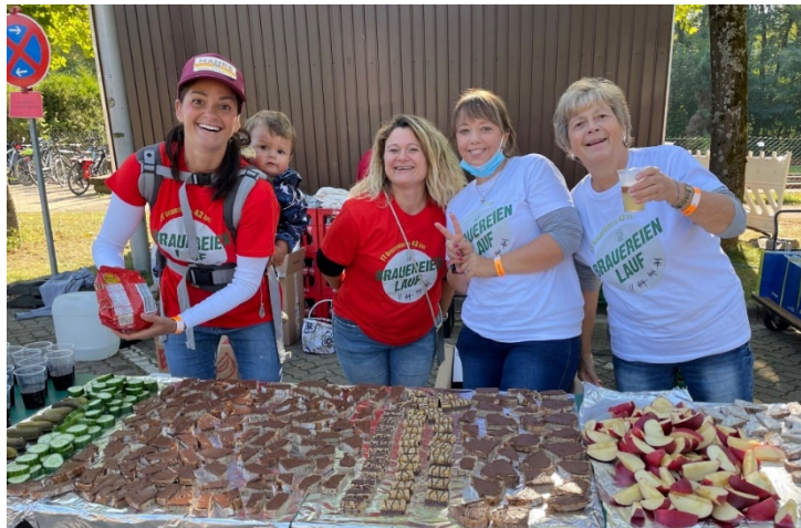
Jung und Alt sind beim Brauereienlauf im Einsatz und haben viel Spaß.

Der „Brauereienlauf Fränkische Toskana“ lädt am Samstag, den 27. September 2025 Laufbegeisterte und Genießer in die Gemeinden Memmelsdorf und Gundelsheim ein. Bereits zum fünften Mal findet das beliebte Event statt, dieses Jahr erstmals als „Nord-Runde“ im Nordosten von Bamberg. Für die Durchführung werden noch ehrenamtliche Helfer gesucht.